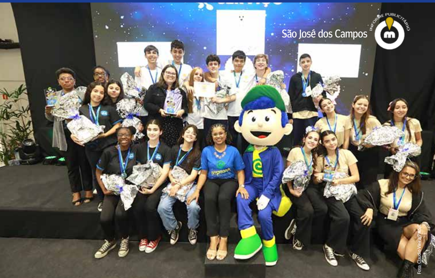
Evento marca o encerramento das atividades de Educação Empreendedora em 2024 e valoriza a criatividade dos estudantes