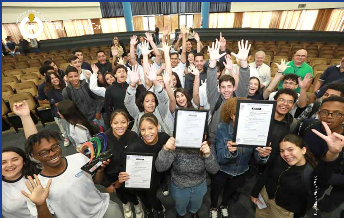
Alunos da Emefi Professora Rosa Tomita mostram certificados durante evento no PIT