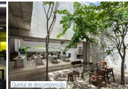
Quintal de desconpressão