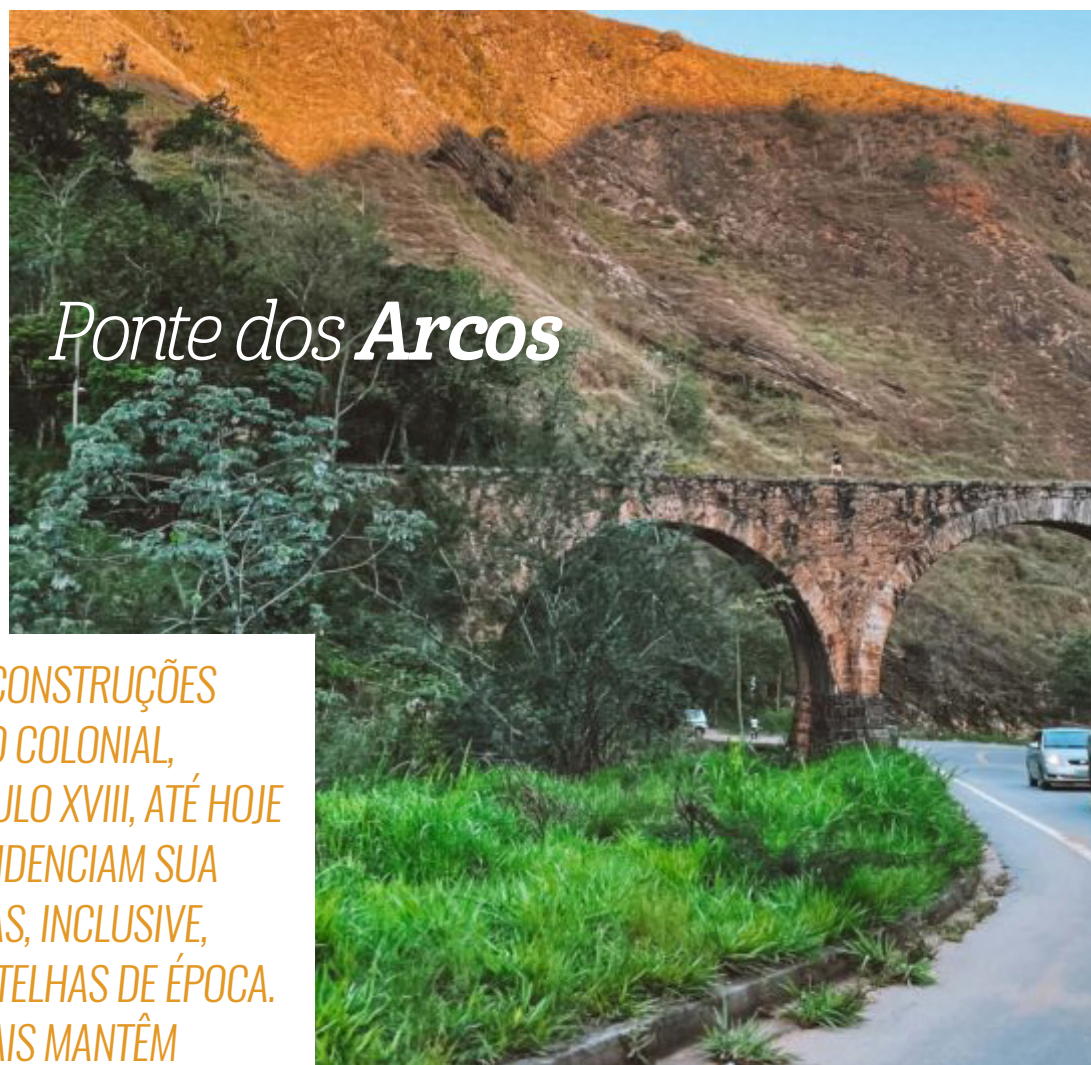
Ponte dos Arcos

O povoado teve inicialmente o nome de Santo Antônio do Rio Bonito, em homenagem ao padroeiro da cidade e ao rio que atravessa a região. Mas a tradição dos índios falou mais alto, e o nome Conservatória ficou marcado para sempre. A prosperidade e riqueza vieram com a expansão da cultura do café, que utilizou o trabalho escravo.