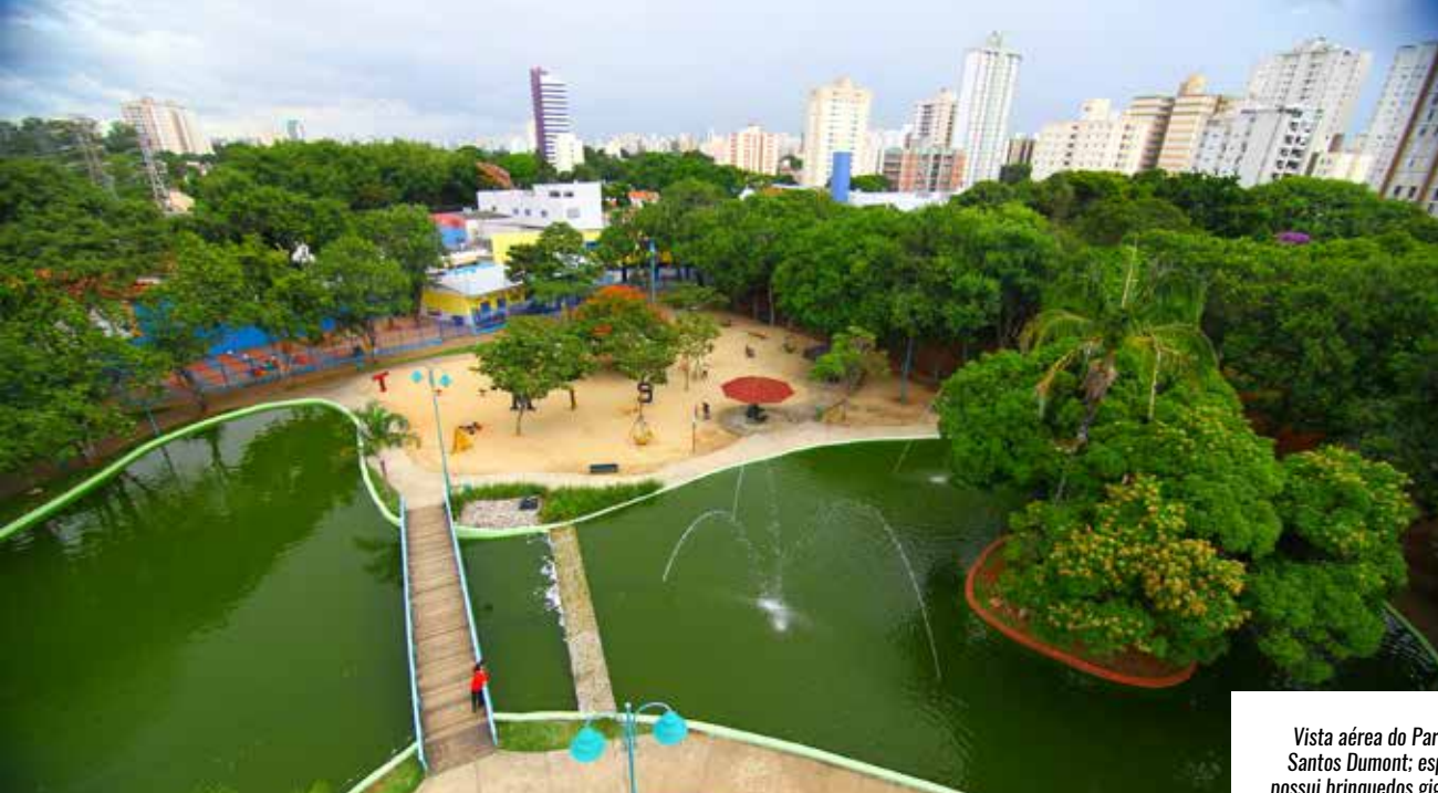
Vista aérea do Parque Santos Dumont; espaço possui brinquedos gigantes, lago e um jardim japonês

PARQUE SANTOS DUMONT/ SÃO JOSÉ DOS CAMPOS