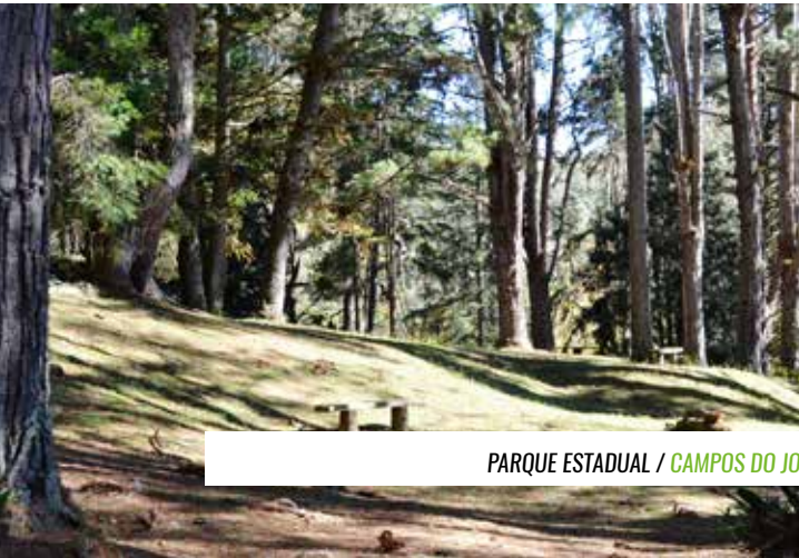
PARQUE ESTADUAL / CAMPOS DO JORDÃO