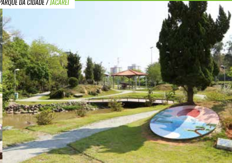
PARQUE DA CIDADE / JACAREÍ