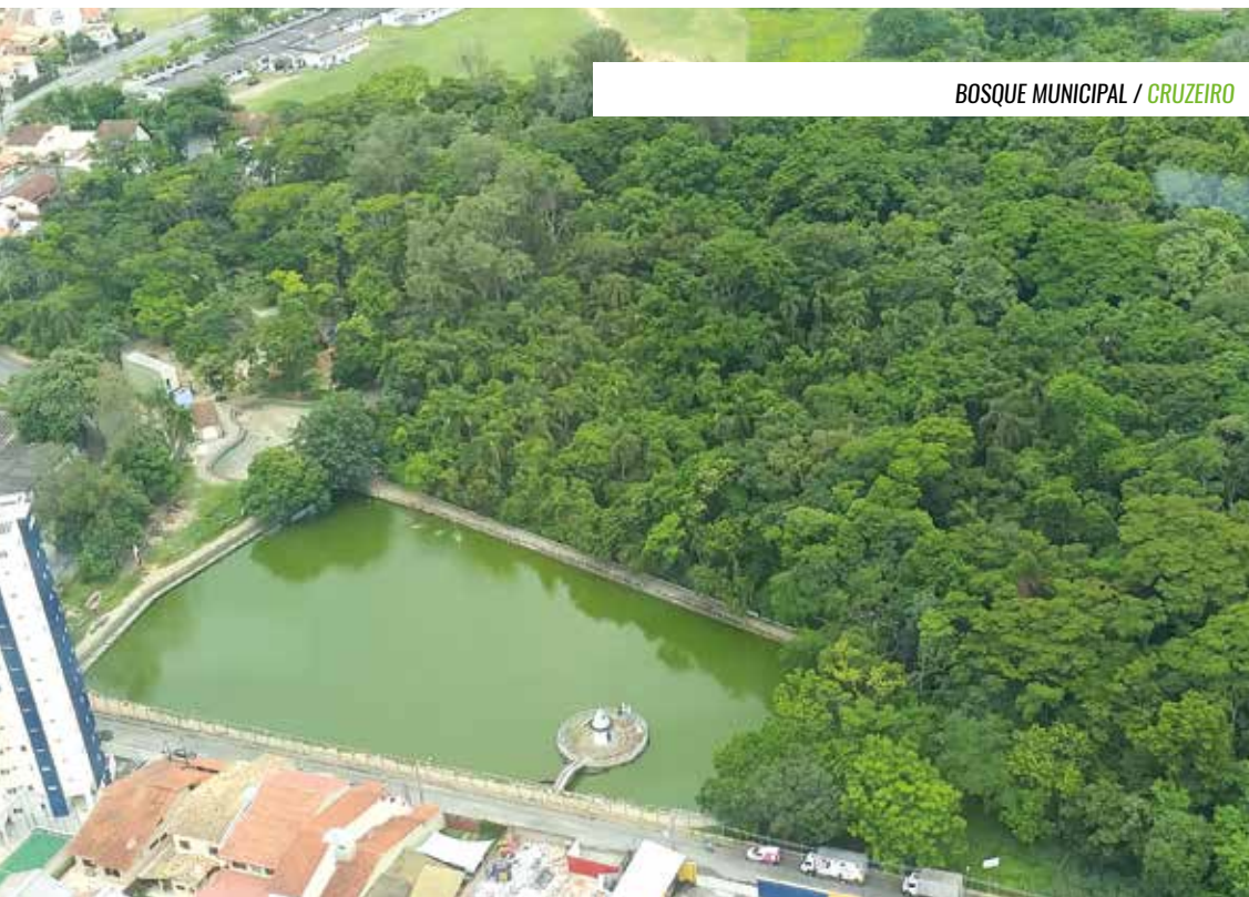
BOSQUE MUNICIPAL / CRUZEIRO

COM 89 MIL M 2 , BOSQUE DE CRUZEIRO É RICO EM BIODIVERSIDADE E POSSUI ÁREA PARA LAZER E ATIVIDADES FÍSICAS