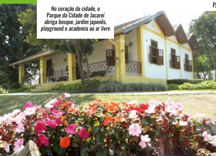
No coração da cidade, o Parque da Cidade de Jacareí abriga bosque, jardim japonês, playground e academia ao ar livre