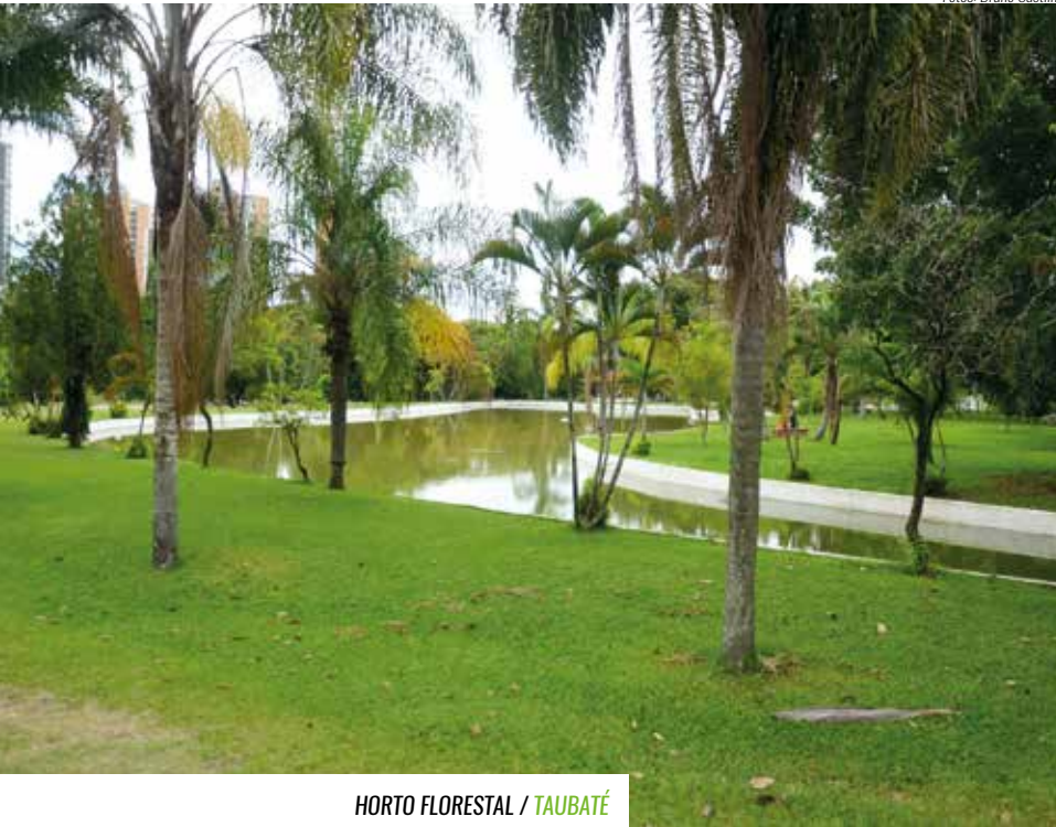
HORTO FLORESTAL / TAUBATÉ