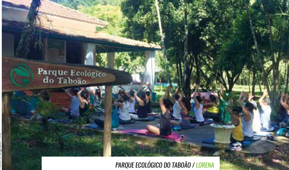
PARQUE ECOLÓGICO DO TABOÃO / LORENA