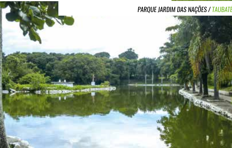
PARQUE JARDIM DAS NAÇÕES / TAUBATÉ

Mas ter parques bonitos não é um privilégio de São José dos Campos na RMVale. Campos do Jordão, Jacareí, Cruzeiro, Taubaté e Lorena estão entre as cidades que oferecem extensas áreas verdes para deleite de moradores e visitantes.