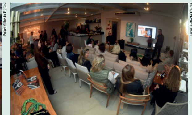
Noite de Autógrafo